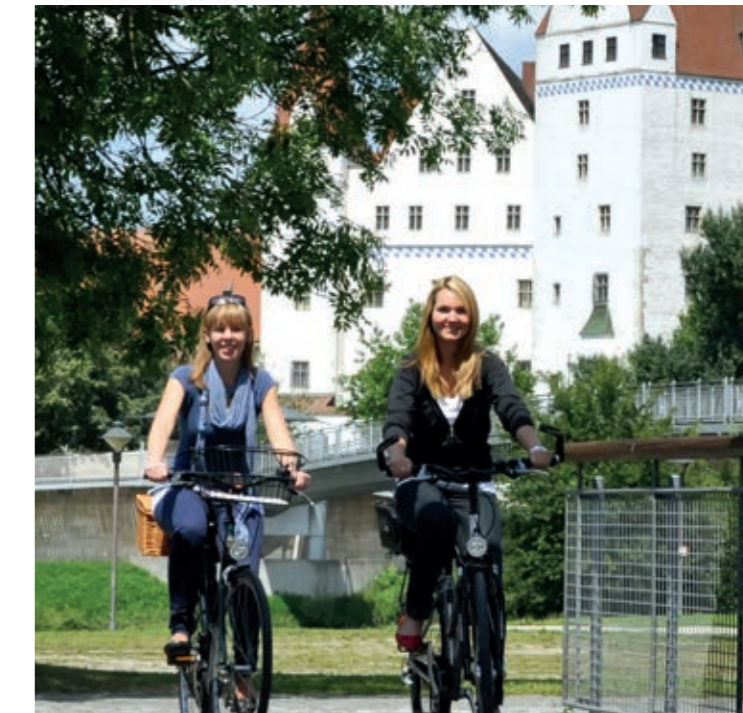
Radler vor dem Neuen Schloss

Wir bitten die Radfahrer, die Verkehrsregeln zu beachten und wenn nötig (z.B. auf Fußgängerwegen) kurz abzusteigen. Ausführliche Informationen bietet ein kostenloses Begleitheft, das in der Tourist Information der Stadt Ingolstadt am Rathausplatz bezogen bzw. online bestellt, oder als PDF heruntergeladen werden kann.