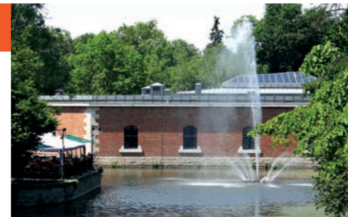
„Fronte 79“ im Glacis

Abschnitt 2 führt entlang der Donau zur Staustufe Ingolstadt über die Fohlenweide und die Kleingartenanlage Moosgärten, vorbei am Westfriedhof und entlang des Künettegrabens zurück zum Ausgangspunkt. Als kleiner Zwischenstopp bietet sich hier der wundervoll gelegene Biergarten „Schutterhof“ an. Naturfreunde kommen besonders auf ihre Kosten, weil die Route Wissenswertes zu den